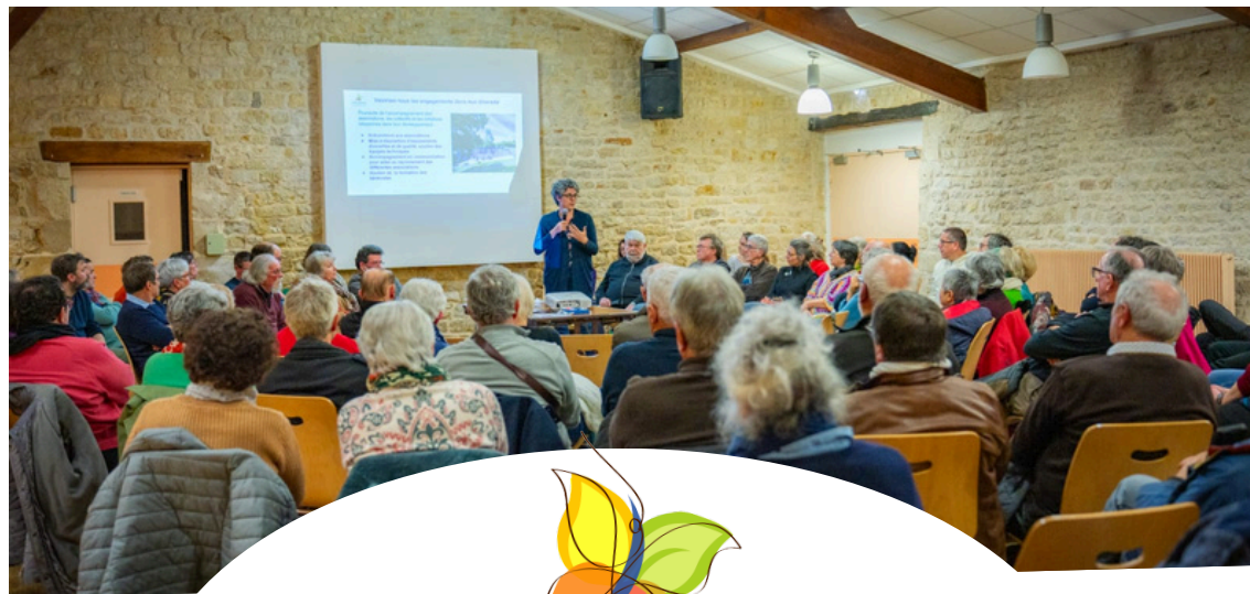
Impression : R.I.C Sauzé-Entre-Bois. Imprimé sur papier recyclé. Ne pas jeter sur la voie publique.